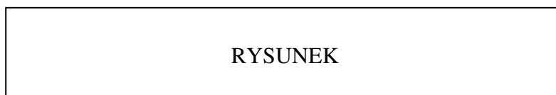
Rys. 23. Fragment schematu organizacyjnego firmy GMC Źródło: R. Jurek Zarządzanie personelem. PWR, Oława 1998, s.9